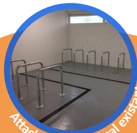
Attache dans un local existant