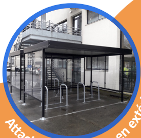
Attache libre d'accès en extérieur